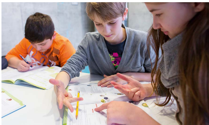
Das «Schweizer Zahlenbuch» regt die Kinder weiterhin an, Muster, Strukturen und eigene Lösungswege selbst zu entdecken.