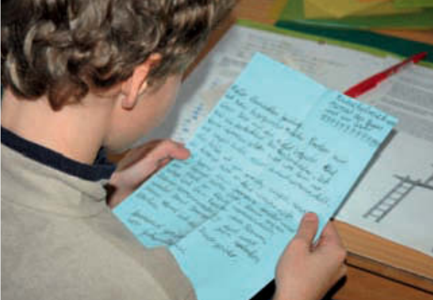
Persönliche Briefe schreiben lernen ist das Sprachlernziel der «Zauberschule».

Aufträge, die anspruchsvoller formuliert sind und die besonders den fremdsprachigen Kindern manchmal zu schaffen machen. In solchen Fällen hilft dann die Lehrerin oder ein Kind mit deutscher Muttersprache weiter.