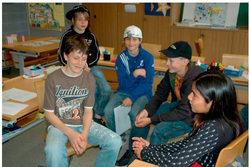
Altersdurchmischter Unterricht gehört zum Bettwiler Schulalltag.