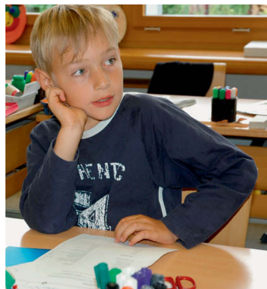
Stationen einer Lektion zum Thema Theater aus den «Sprachstarken 4».