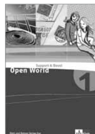
Kopiervorlagen Support and Boost