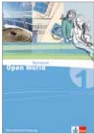
Workbook mit Trainings-Software