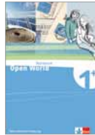
Workbook+ mit Trainings-Software+